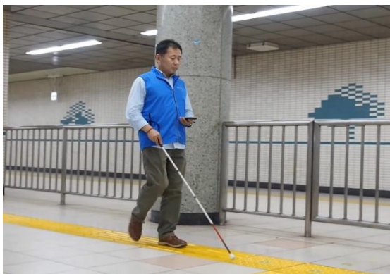
ご利用時のイメージ