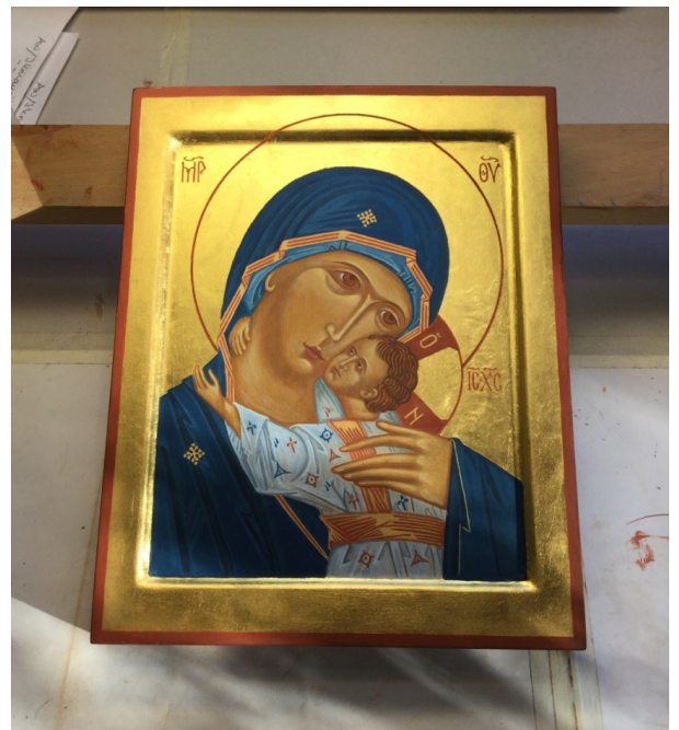
Ömhetens Gudsmoder (20x25 cm) Målad av PO Petrus Wikström 2017