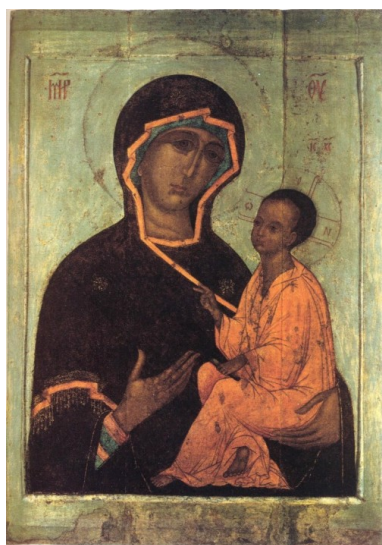
Gudsmodern av Tichvin, (Rysk, mitten av 1500-t.)

Den viktigaste och inom hela ortodoxin mest spridda är Hodigitria , Den vägvisande Gudsmodern , som t.ex. Gudsmoderikonen av Tichvin» – nedan visas två utföranden av detta motiv, ett gammalt och ett nutida.