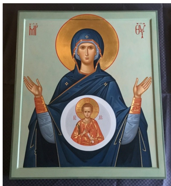
Tecknets Gudsmoder Ikonen målad av G Gashev (Återgiven med hans tillstånd.)

Motivvarianten med Kristus-Immanuel avbildad i en gloria har kommit att bli mycket älskad i Ryssland, alldeles speciellt i Novgorod och trakten däromkring. Den kallas på ryska Znamenie, efter det ryska ordet för ”tecken”, Znak, på svenska Tecknets Gudsmoder .