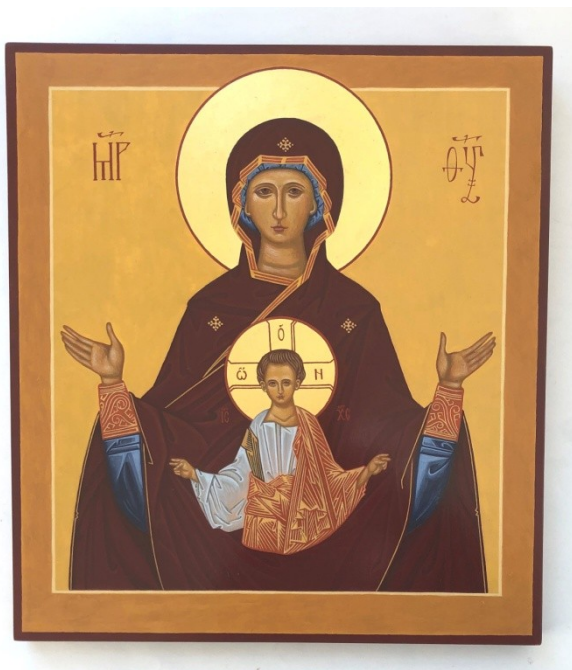
Tecknets Gudsmoder Ikonen målad av PO Petrus Wikström

I en del varianter av motivet – oftast i halvfigur - håller Guds Moder Kristus i sin famn (återgiven som Kristus Immanuel ), i andra visas han i en mandorla eller gloria.