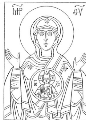
Tecknets Gudsmoder (Ry. Znamenie ) 3

Flertalet av de många Gudsmodersikonerna kan återföras på ovanstående tre huvudtyper.