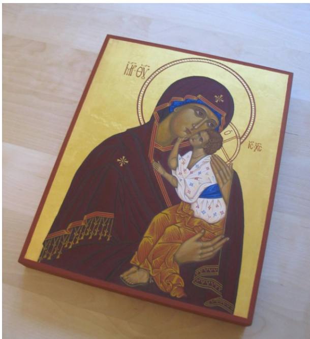
Gudsmoderikonen »Jaroslavl» (24x30 cm) Målad av PO Petrus Wikström 2012

Nedan några varianter på temat »Ömhetens Gudsmoder: