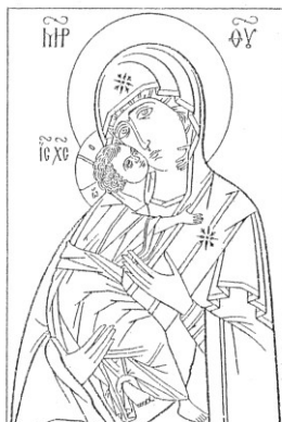
Ömhetens Gudsmoder (gr. Eleousa Ry. Umilenie ) 3