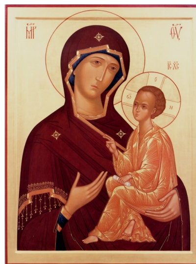
Gudsmodern av Tichvin. (G. Gashev, 1990-t; Bilden återgiven med hans tillåtelse.)