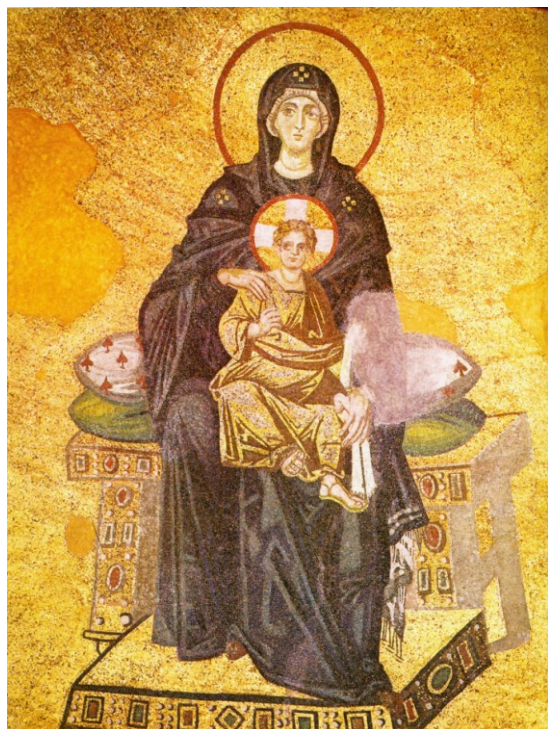
Den tronande Guds Moder, Absidmosaik, år 867 Hagia Sofiakatedralen i Istanbul (Konstantinopel)

Guds moder kan också återges sittande på en tron med Kristus Immanuel i sitt knä, han håller en bokrulle i sin vänstra hand och välsignar med den högra.