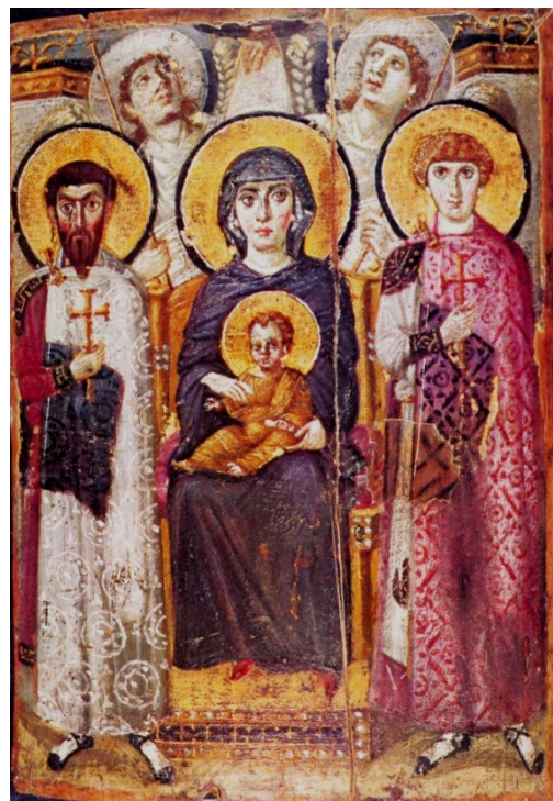
Den tronande Guds Moder, eukaustikikon 500-talet, Katarinaklostret, Sinai