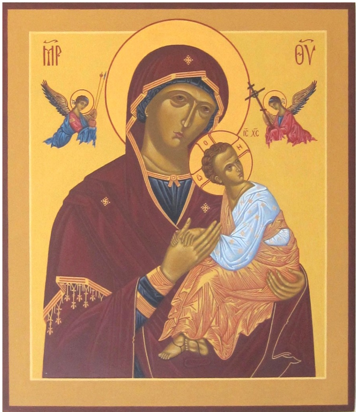
Lidandets Gudsmoder Ikonen målad av PO Petrus Wikströms hand 2015 (24x30 cm)